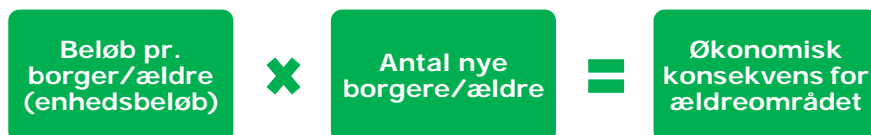
Figur 2 Grundprincippet i en demografimodel

I afsnit 3 redegøres yderligere for de tekniske regneprincipper i forslaget til den nye demografimodel på ældreområdet i Viborg Kommune.