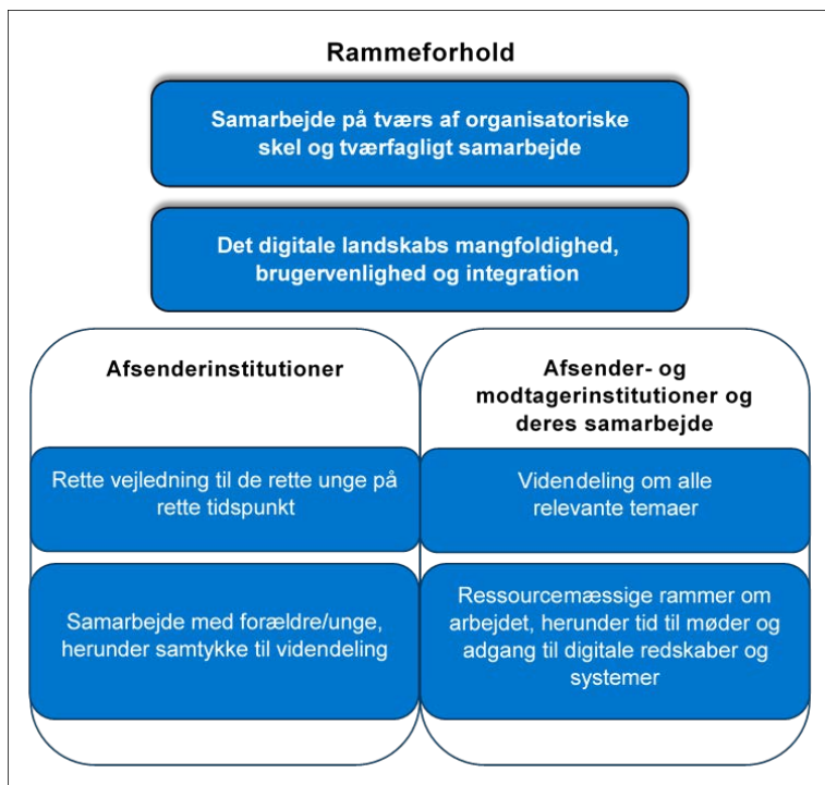
Figur 3 Udfordringer og behov i samarbejdet om unges overgange fra grundskole til ungdomsuddannelse

Som det fremgår af figuren ovenfor, kan de identificerede udfordringer og behov indeles efter, om de primært udspringer af rammeforhold om samarbejdet, om de primært vedrører afsenderinstitutionerne, og endelig om de vedrører både afsender- og modtagerinstitutioner og deres samarbejde.